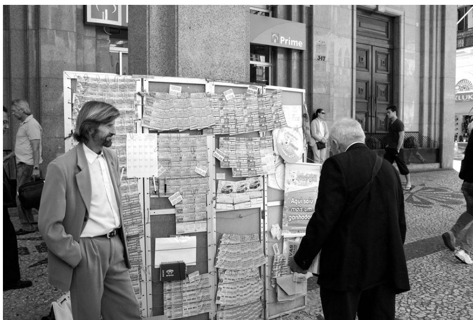
Fotografía 9. Compartiendo el cotidiano. Flávio Sousa. 2009.

La XV muestra otra de sus muchas caras en relación al trabajo informal. En momentos muy específicos puede ser tomada por olas de trabajadores que sacan provecho de fenómenos puntuales como manifestaciones populares, mítines políticos, eventos artísticos, o simplemente la lluvia, para vender sus productos. Este caso específico nos lleva a pensar en el tipo de relación que existe entre trabajadores informales callejeros. Mientras hacía fotografías fui interpelado por el vendedor de paraguas que me preguntó para que eran las fotografías. Le comenté rápidamente que se trataba de un trabajo antropológico, que era de la universidad, y que las fotografías no eran para ninguna revista o periódico, ya que esa era su principal preocupación. La venta en la calle está reglamentada y en este caso el vendedor no tenía los permisos necesarios. De ahí su preocupación en resguardar su identidad.