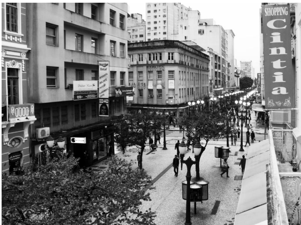
Fotografía 2. Fotografía de la calle desde un balcón de uno de sus muchos centros comerciales. Flávio Sousa. 2009

La XV de Novembro es la calle comercial más importante de la ciudad. Por ella circulan diariamente miles de personas en busca de los más diversos artículos y de los servicios propios de la calle