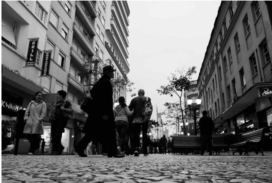
Fotografía 1. Fotografía de la Rua XV de Novembro tomada en un día de actividad laboral normal. Flávio Sousa. 2009

La XV de Novembro es la calle comercial más importante de la ciudad. Por ella circulan diariamente miles de personas en busca de los más diversos artículos y de los servicios propios de la calle