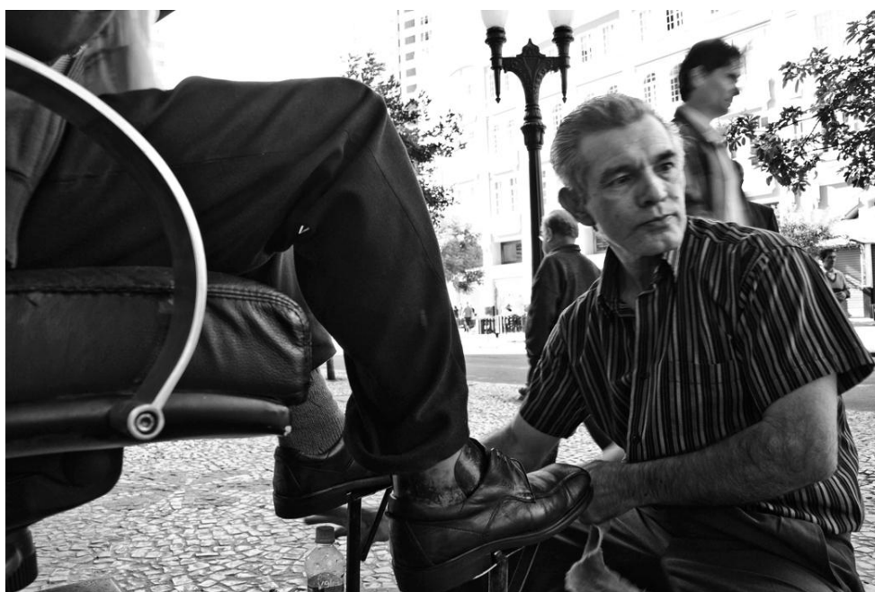
Fotografía 11. Compartiendo el cotidiano. Flávio Sousa. 2009.

En las fotografías 9, 10 y 11 nos encontramos a los trabajadores que fueron el objetivo principal de la etnografía visual. Algunos de ellos llevan décadas ejerciendo su profesión en puntos específicos de la XV. Su permanencia continuada en este espacio hace que tengan una clientela más o menos fija. Aquí nos encontramos con una invisibilidad relativa. Los trabajadores, en general, pasan desapercibidos para la gran masa de peatones que invade la calle a diario, pero no para los clientes habituales a los que prestan servicios desde hace años. En muchos momentos, hablando con los trabajadores de la calle y eventualmente con sus clientes, he visto relaciones cercanas y duraderas, verdaderas relaciones de amistad.