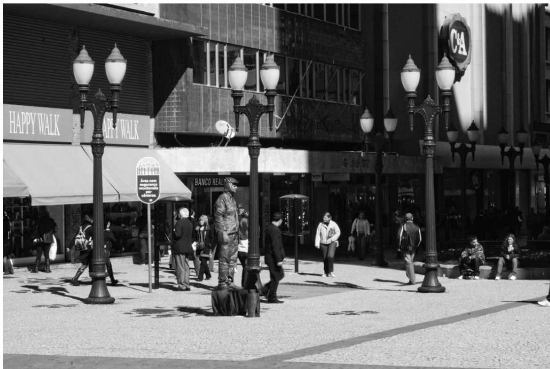
Fotografía 3. Estatua viviente en la XV de Novembro. Flávio Sousa. 2009.

Es este el punto específico trabajado por esta etnografía visual: las relaciones sociales, efímeras o profundas, desarrolladas entre los trabajadores de la Rua XV de Novembro y las personas que circulan por ella. Estas relaciones, de alguna forma, son de difícil percepción, ya que los trabajadores están incorporados al paisaje de la calle y al imaginario de la ciudad. Por esta total inclusión en el escenario urbano muchos de estos trabajadores pasan desapercibidos, son invisibles a los ojos menos atentos. En este sentido surge la necesidad de una mirada un poco más aguzada para que éstos puedan ser vistos y percibidos como los agentes sociales activos que son. Nuestro trabajo intenta sólo dar contraste y llamar la atención, a través de un instrumento gráfico, la fotografía, hacia estas relaciones sociales que transcurren a cada instante en el diversificado ambiente de la XV de Novembro. Como hemos dicho ya, nuestra intención es que el espectador reflexione, a través de la fotografía, sobre tal realidad, a partir de las pequeñas pistas dadas por el autor.