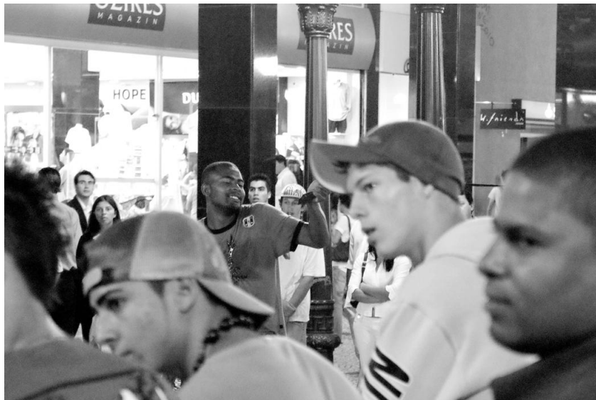
Fotografía 13. El circo en la calle. Flávio Sousa. 2009.

Las presentaciones de carácter circense, tanto de payasos como de acróbatas, también encuentran su espacio en esta calle. Este es un ejemplo de trabajadores que se desplazan por algunas plazas y calles del centro, pero que tienen la XV de Noviembre como principal escenario. No he identificado ningún tipo de conflicto por la distribución del espacio en la calle, ya que al parecer existe un acuerdo tácito que rige la distribución del espacio. En una ocasión sí se produjo un conflicto puntual, cuando un grupo de teatro que trataba cuestiones de concienciación medioambiental, le molestaba a un guitarrista callejero habitual de la calle que había llegado antes que el grupo. En general las actuaciones circenses tienen un público significativo.