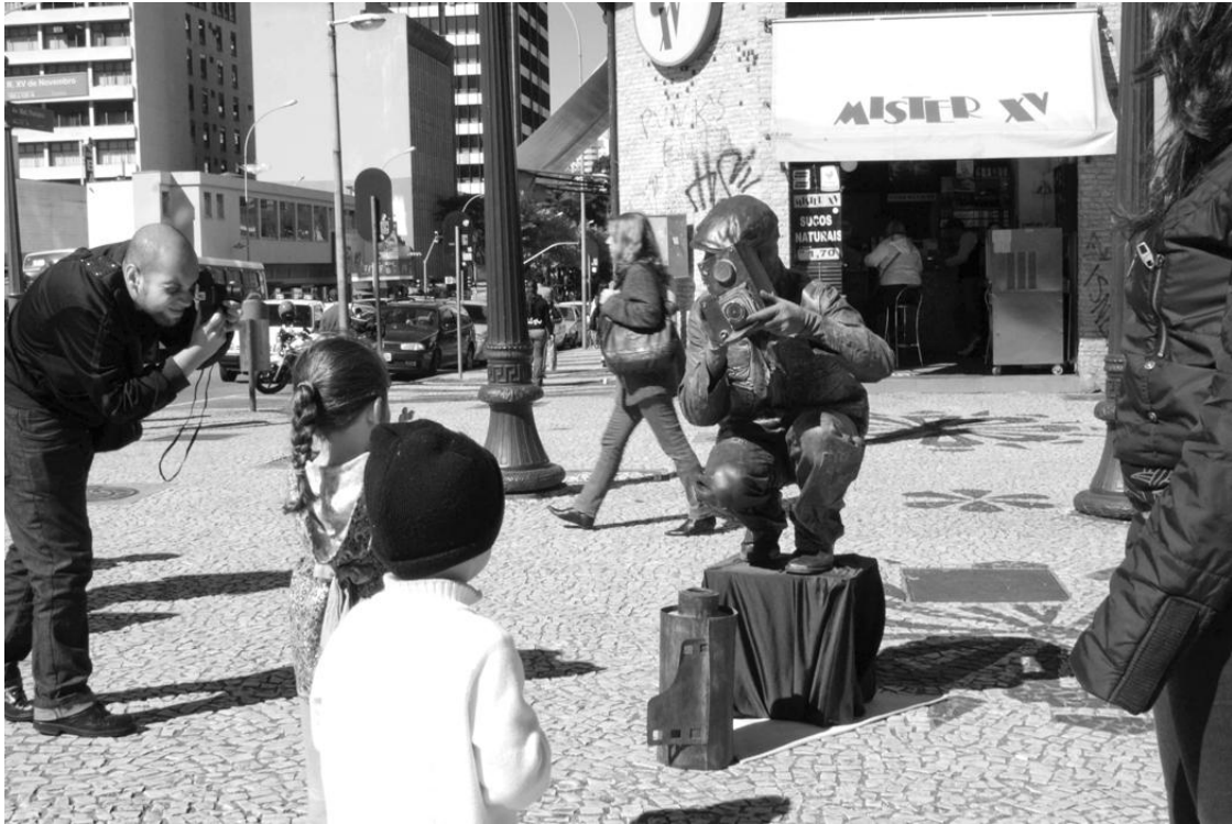
Fotografía 4. Fotógrafos y fotografiados. Flávio Sousa. 2009.

En la fotografía 4 ficción y realidad se mezclan cuando un fotógrafo espontáneo fotografía al actor, que a su vez fotografía a los niños. En este momento la relación se profundiza. Surge de ahí una relación socio-económica entre actor y niño, relación que es evidentemente uno de los principales motivadores para el ejercicio del trabajo callejero específico.