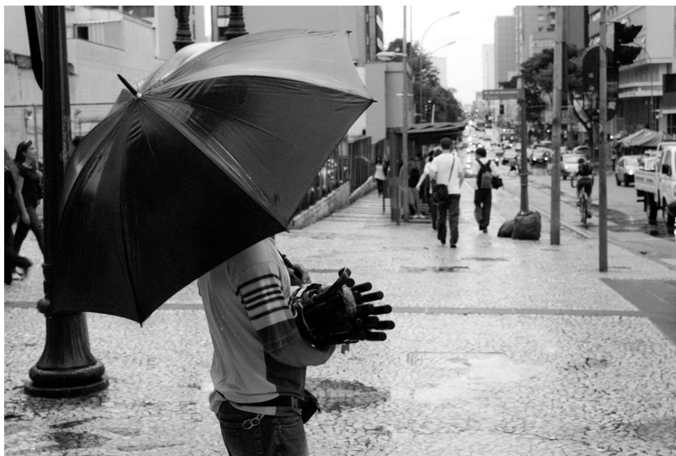
Fotografía 8. Tarde de lluvia. Flávio Sousa. 2009.

La XV muestra otra de sus muchas caras en relación al trabajo informal. En momentos muy específicos puede ser tomada por olas de trabajadores que sacan provecho de fenómenos puntuales como manifestaciones populares, mítines políticos, eventos artísticos, o simplemente la lluvia, para vender sus productos. Este caso específico nos lleva a pensar en el tipo de relación que existe entre trabajadores informales callejeros. Mientras hacía fotografías fui interpelado por el vendedor de paraguas que me preguntó para que eran las fotografías. Le comenté rápidamente que se trataba de un trabajo antropológico, que era de la universidad, y que las fotografías no eran para ninguna revista o periódico, ya que esa era su principal preocupación. La venta en la calle está reglamentada y en este caso el vendedor no tenía los permisos necesarios. De ahí su preocupación en resguardar su identidad.