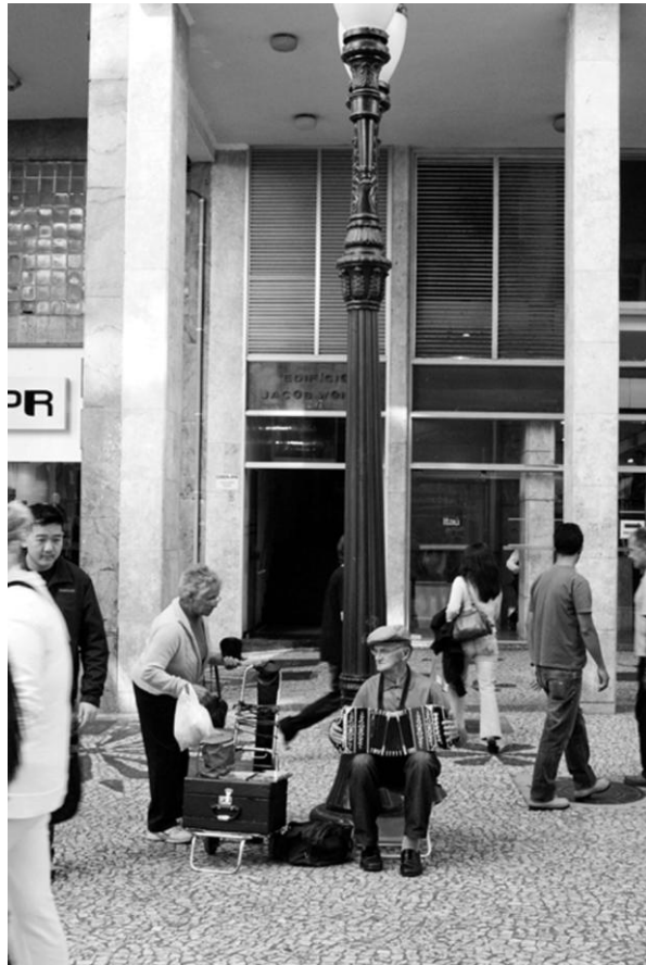
Fotografía 17. Músicos callejeros. Flávio Sousa. 2009.

Al igual que para los artistas circenses, la Rua XV de Novembro es el principal espacio para los músicos