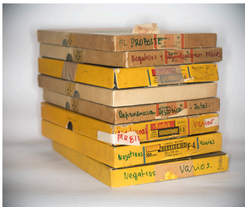
Imagen 05: Contenedores originales de fotografías y negativos de la colección fotográfica Montandon. Juan Carlos Gutiérrez. 2019. Archivo Fotográfico Roberto Montandon del CMN.

fueron declaradas Monumento Nacional, en la categoría de Monumento Histórico, mediante el Decreto N° 5 del 26 de enero de 2023.