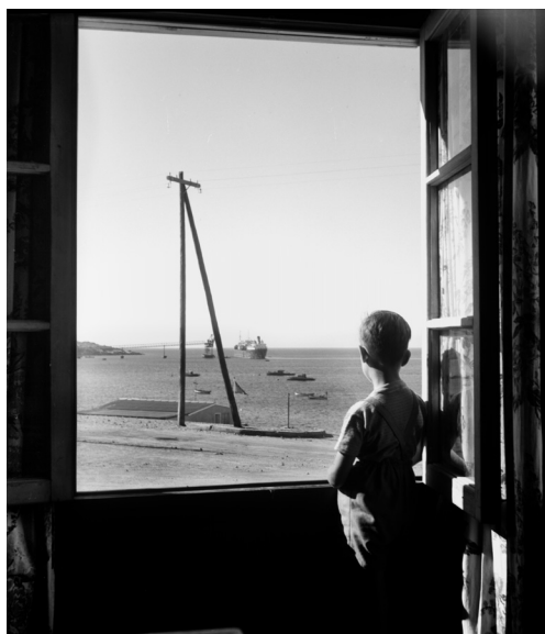
Imagen 13: Niño mirando hacia el mar, norte de Chile. Roberto Montandon. S/F. Archivo Fotográfico Roberto Montandon del CMN.