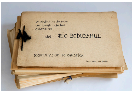
Imagen 10: Informe fotográfico de la expedición al río Vodudahue año 1939.

A nivel institucional, en 2022 se trabajó en la puesta en valor de la Colección Montandon a través de la exposición «Resplandor del Fuego: Roberto Montandon», muestra instalada en el Palacio Pereira y curada por el historiador Gonzalo Leiva. En el marco de la exhibición se generaron los siguientes productos: una publicación del mismo nombre de la exposición; dos conversatorios, uno en torno a la conservación del patrimonio chileno y el otro dedicado a identidades y visualidades, haciendo los cruces con el trabajo fotográfico de Montandon; y el documental Resplandor del Fuego , disponible en https://www.youtube.com/watch?v=u0VcHNVkU-Q , donde se recogen testimonios de las personas que conocieron y trabajaron con Montandon.