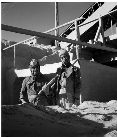
Imagen 12: Obreros en una faena, Oficina Salitrera María Elena. Roberto Montandon. c. 1950. Archivo Fotográfico Roberto Montandon del CMN.

Por otra parte, cuando el Archivo recibe transferencias de imágenes, principalmente digitales, desde el interior de la Secretaría Técnica del CMN, aquellas pasan a conformar el acervo de la Colección.