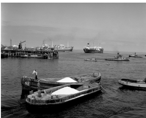
Imagen 15: Puerto y muelle de pescadores, Tocopilla. Roberto Montandon. 1948. Archivo Fotográfico Roberto Montandon del CMN.

¿Cómo se relaciona el Archivo Fotográfico con otras unidades y directrices del Serpat, como por ejemplo con el Protocolo del Archivo de la Biblioteca Nacional?