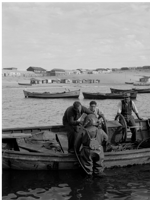
Imagen 3: Buzo con casco, puerto de Caldera. Roberto Montandon. 1947. Archivo Fotográfico Roberto Montandon del CMN.

El principal fondo es la Colección Fotográfica Montandon, con 14.448 registros —principalmente negativos en blanco y negro— realizados por Roberto Montandon en el ejercicio de su función pública en diferentes instituciones entre 1939 y 1990, sobre arquitectura, paisajes, personas y oficios. La Colección Fotográfica Histórica cuenta con imágenes de diferente data —en su mayoría soporte papel— sobre expedientes de declaratoria, intervenciones en Monumentos Nacionales, informes de trabajos en terreno y actualización del registro visual de los monumentos existentes en el país, realizadas por los funcionarios de la Secretaría Técnica para documentar el estado actual de los Monumentos y solicitadas como elementos probatorios o para documentar informes técnicos. La Colección Fotográfica Digital, en permanente crecimiento y consultada con bastante frecuencia por funcionarios de la Secretaría Técnica CMN, retrata el estado del patrimonio protegido durante los últimos años, utilizando para ello estándares de preservación digital. Aquí se encuentran las fotografías nativas digitales, las que también se utilizan para documentar informes técnicos.