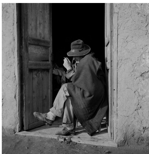
Imagen 09: Hombre sentado bajo un pórtico. Roberto Montandon. S/F. Archivo Fotográfico Roberto Montandon del CMN.