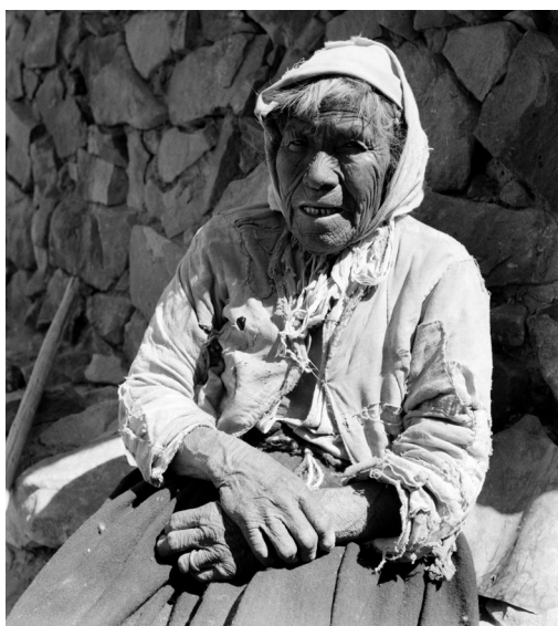
Imagen 11: Retrato de mujer, pueblo de Cupo. Roberto Montandon. 1950. Archivo Fotográfico Roberto Montandon del CMN.

Además, en agosto de 2021 se realizó la exposición «Roberto Montandon, El Pasado Presente», fruto del trabajo entre la Embajada de Suiza, el Ministerio de las Culturas, las Artes y el Patrimonio –bajo la gestión del Consejo de Monumentos Nacionales– y Umwelt, en la Galería Suizspacio, ubicada en la estación de Metro Ñuñoa. Esta muestra itineró por Valdivia (Museo de Sitio Castillo de Niebla), Temuco (Museo Nacional Ferroviario Pablo Neruda), Chillán (Sala Obra Gruesa del Teatro Municipal de Chillán) y Santiago (Casa Museo Eduardo Frei Montalva).