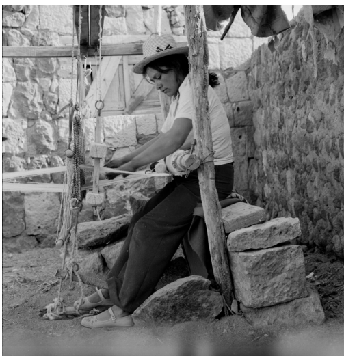
Imagen 14: Tejedora a telar, Socaire. Roberto Montandon. c. 1980. Archivo Fotográfico Roberto Montandon del CMN.