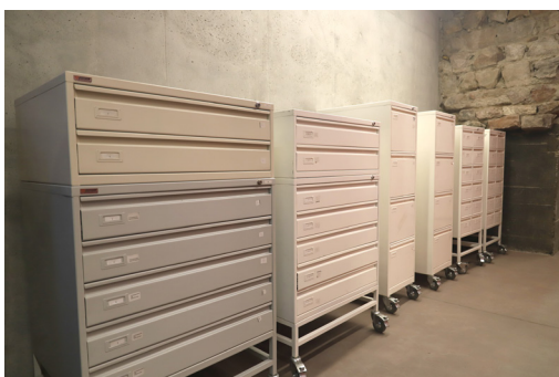
Imagen 06: Muebles de conservación para colección de negativos y positivos Archivo Fotográfico. Juan Carlos Gutiérrez. 2021. Archivo Fotográfico Roberto Montandon del CMN.

Por último, la Colección Montandon se forma a partir de un archivo personal, que ha ido creciendo debido al conocimiento que hay del acervo documental que generó en las distintas instancias donde él se desempeñó, como también de sus colaboradores.