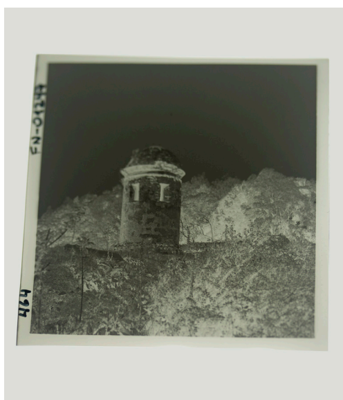
Imagen 4: Negativo de la colección Montandon en formato 6x6 cm. Juan Carlos Gutiérrez. 2019. Archivo Fotográfico Roberto Montandon del CMN.

La Colección Montandon es de suma importancia para el país y también para nuestra institución, por cuanto retrata a personas, construcciones y espacios naturales de nuestra vasta geografía, además de prácticas y situaciones de la vida cotidiana de quienes dieron forma a nuestra identidad. A través de las imágenes, se posibilita fijar y presentar un relato sobre el patrimonio cultural. Tal es el valor de estas fotografías y soportes que 14.448 de ellas, junto con los 3.202 documentos y los 554 libros,