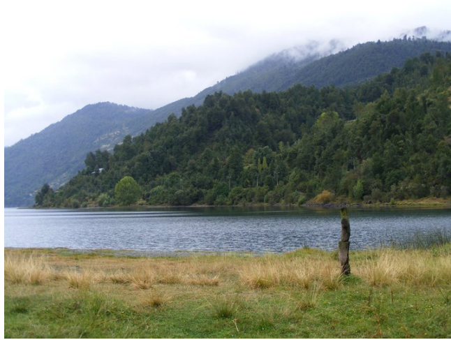
Foto 4: Pampa de Guilatuwe y rehue a orillas de Lago Neltume.

del equilibrio ecosistémico entre la comunidad, el individuo y la naturaleza, llevado a cabo preferentemente en meses de noviembre o diciembre.