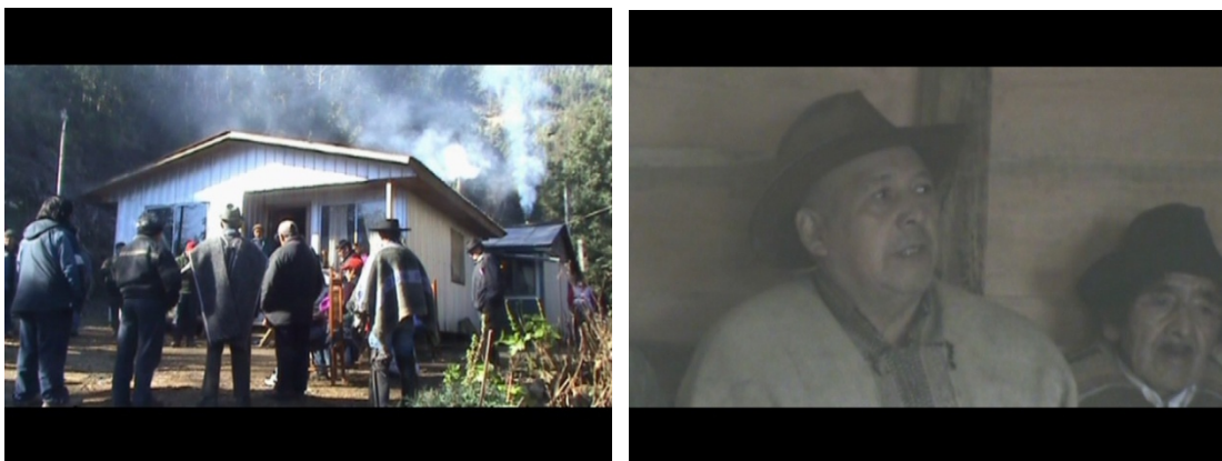
Foto 7 (izquierda) y 8 (derecha): Fotogramas del documental “Lago Neltume: Kume Mogñen Tain Mapu Mew” (Hasen, 2010), donde se aprecia una de las reuniones que la comunidad autorizo a filmar

En gran parte, este documental fue hecho por las propias comunidades, toda vez que eran ellas las que nos invitaban a participar activamente, siendo nuestra tarea asignada durante el desarrollo de las reuniones, el registro audiovisual. Las mismas comunidades nos alimentaban y daban alojamiento, en las largas visitas que se hicieron a las comunidades, además de ser ellas mismas las protagonistas, a través de los relatos sinceros y muchas veces desgarradores.