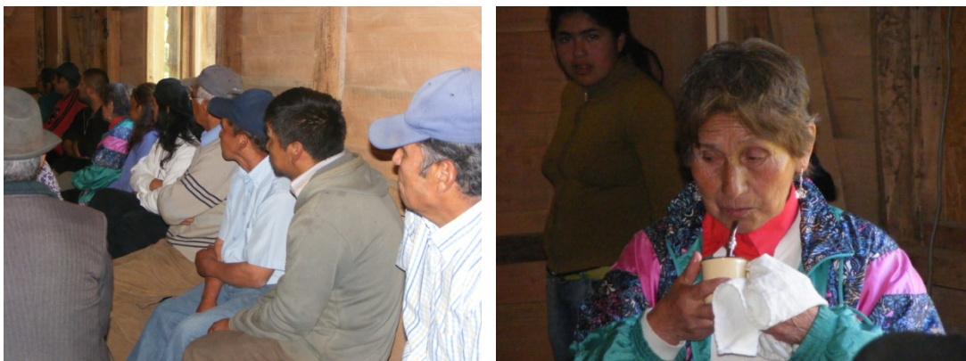
Foto 13 (izquierda) y 14 (derecha): Secuencia de fotografías de la exhibición del documental en las comunidades de Lago Neltume. Fuente: Felipe Hasen. 2010