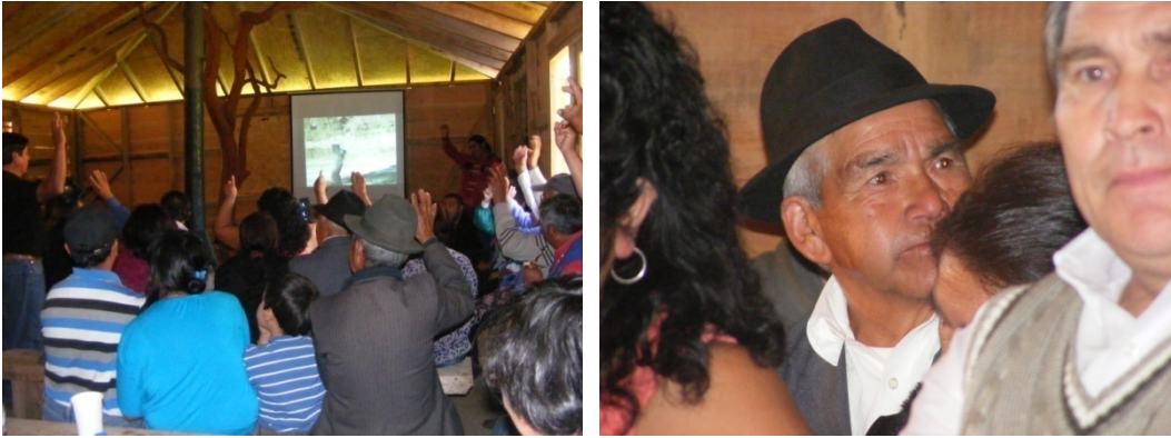
Foto 15 (izquierda) y 16 (derecha): Secuencia de fotografías de la exhibición del documental en las comunidades de Lago Neltume. Fuente: Felipe Hasen. 2010