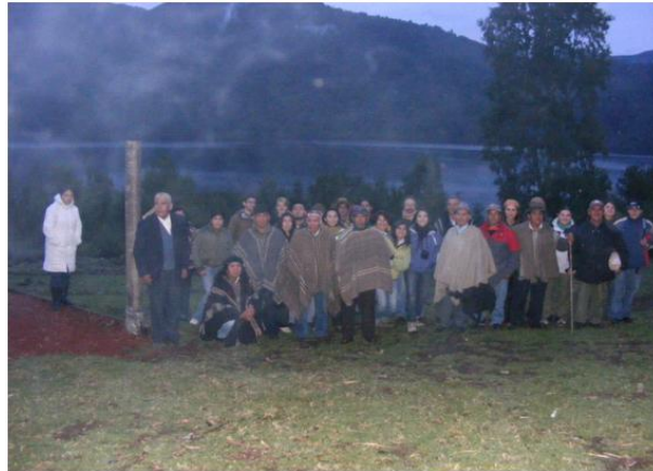
Foto 3: Primera reunión con las comunidades de Juan Quintuman e Inalafquen. 2009