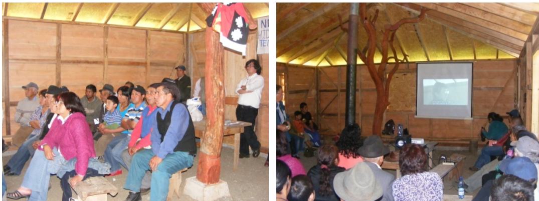
Foto 11 (izquierda) y 12 (derecha): Secuencia de fotografías de la exhibición del documental en las comunidades de Lago Neltume.

Ya estamos adentro, todos sentados y listos para la función, se enciende el proyector y todos en silencio. Risas nerviosas se escuchan de cada uno a medida que se ve en la pantalla hablando, el resto en silencio y atentos. Mientras vemos la película los mates y las sopaipillas no dejan de transitar.