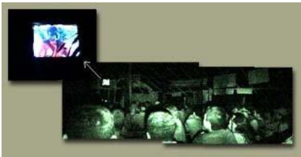
Sesiones de presentación de los ejercicios al colectivo. Algunos de los ejercicios posteriormente fueron exhibidos ante el colectivo.