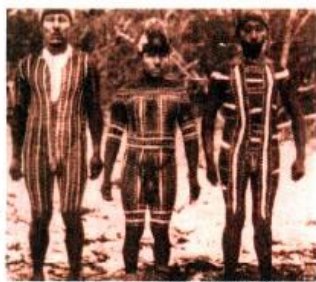
Onas en ceremonia de iniciación.

Esta misma desnudez se transforma en fascinación de los ‘primeros habitantes de Chile’ (Musalem, et al. , 2003:45). Sus cuerpos pintados nos llevan a un mundo extraño, primigenio, inspirador de las más numerosas fantasías y contextos hasta el día de hoy.