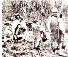
Los cazadores recolectores del sur del continente americano vivieron en condiciones materiales muy precarias.

Veamos algunos ejemplos relativos a las imágenes fotográficas de los ‘fueguinos’.