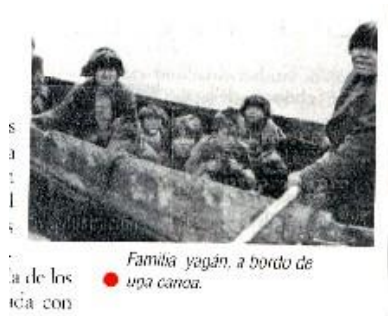
Familia yagán, a bordo de una canoa.

habitación tradicional mapuche y se le asigna el rol de ser una de las ‘ chozas con formas de colmena ’ de la cultura alacalufe o kawesqar.