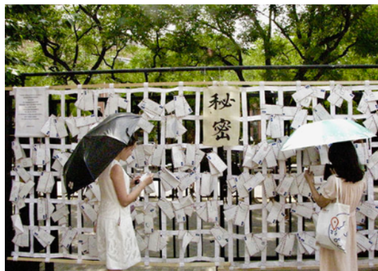
Imagen 3.