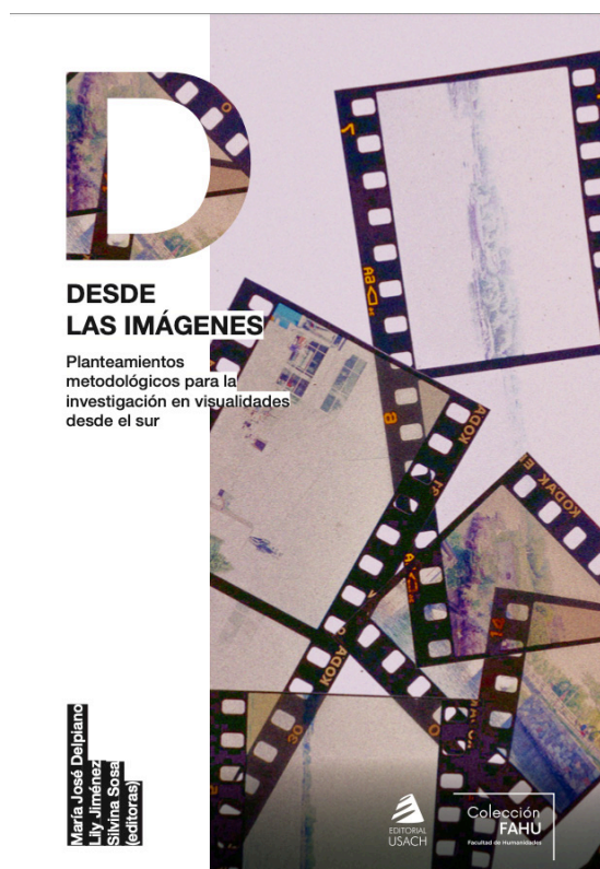
Imagen 1. Portada Libro. Desde las imágenes. Planteamientos metodológicos para la investigación en visualidades desde el sur , 2025.

Los escritos que componen el volumen tienen su origen en el primer Coloquio del Núcleo de Investigaciones en Visualidades Metodologías y Prácticas de la Imagen desde el Sur, realizado en noviembre de 2021, textos a los que se suman colaboraciones académicas internacionales. A través de sus ocho capítulos, el volumen nos propone nuevas perspectivas para pensar el rol de las imágenes y de la visualidad en la investigación en disciplinas como la historia, los estudios de la religión, la antropología, entre otros, y lo hace mediante propuestas metodológicas que no solo dan respuestas originales al trabajo