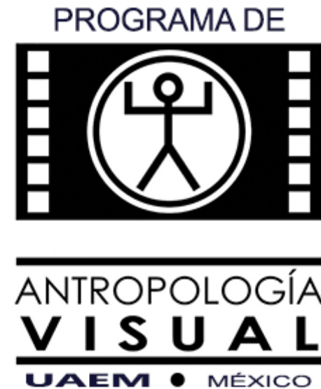
Imagen 9: Logo del Programa de Antropología Visual. Universidad Autónoma del estado de Morelos.