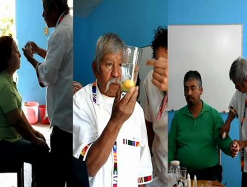
Imagen 6: Fotograma de “Limpia de Huevo”. Maiya Guarneros. 2013.

En este último punto, vemos por ejemplo que tópicos como la violencia generalizada en el Estado (el cual tiene los mayores índices de secuestros en el país), la pobreza o los migrantes provenientes de otros estados de la república casi no han aparecido en las temáticas estudiantiles o lo hacen de manera muy sutil a pesar de ser situaciones prevalentes e importantes en sus espacios donde se movilizan.