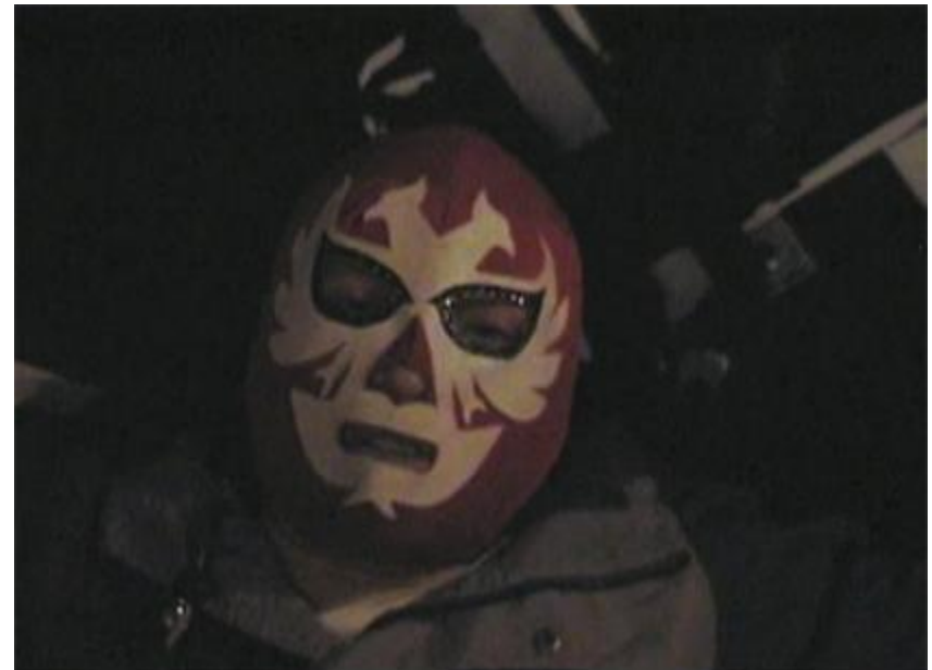
Imagen 3: Fotograma de “Prostitución: una doble vida” Daniel Luvianos y Lorena Reyes. 2008.

La forma que se fue modelando en el nuevo escenario académico tuvo desde el principio tres condiciones fundamentales: a) No decir qué investigar y producir; b) partir de que en principio no hay un “buen” material audiovisual y uno “malo” tanto en lo técnico como en su textualización narrativa y poner más bien el énfasis en la intención antropológica; y c) aprender colectivamente apoyándose en la cultura audiovisual preexistente en todos los estudiantes. Estos tres preceptos básicos redundaron en la posibilidad de superar algunas de las limitaciones propias del programa ya mencionadas al flexibilizar las opciones que habría de tomar cada quien y al mismo tiempo desmitificar el proceso de producción audiovisual.