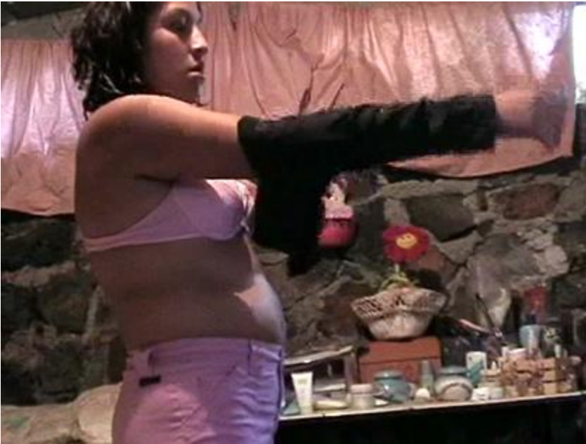
Imagen 2: Fotograma de “12 horas de 3 jóvenes morelenses” Laksmi de Mora. 2005.

Tras mi paso doctoral en Manchester, fui invitado a participar como catedrático visitante por algunos años en una nueva maestría en antropología visual en Goldsmiths College, Universidad de Londres. Este nuevo programa en Inglaterra no enfatizaba tanto en el estilo observacional, ni en que todos sus estudiantes tuvieran necesariamente una formación antropológica previa, lo cual lo hacía proclive hacia formas de capacitación más flexibles en cuanto a técnicas, metodologías y estilos narrativos. En todo caso, ambas experiencias en el Reino Unido me sirvieron de base teórico-metodológica que habría de aplicar en la UAEM cuando fui contratado en 2005 como profesor/investigador de tiempo completo en su relativamente nuevo Departamento de Antropología. Una vez allí y aprovechando mi experiencia, se abrió la materia optativa de antropología visual para estudiantes de licenciatura de la facultad, curso que pronto se volvió muy popular y dio origen al PAV-UAEM.