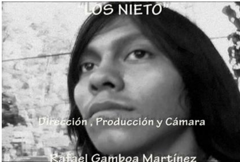
Imagen 8: Fotograma de "Los Nieto". Rafael Gamboa. 2008.

En ese sentido, la mayoría de los alumnos participantes provienen de estratos medios urbanos y semiurbanos de los Estados mexicanos de Morelos y Guerrero, locaciones que se encuentran en agudos procesos sociales de confrontación y transformación lo que con frecuencia impregna la visión antropológica de ellos. Es por ello que el programa ha puesto especial énfasis en transmitir experiencias sobre cómo textualizar audiovisualmente hechos y dramas sociales que suceden en la cotidianidad de la vida de muchos estudiantes. Claramente, el analizar lo producido en estos 10 años, nos permite hacer un primer mapeo diacrónico sobre los temas que han sido relevantes a quienes intentan expresarse audiovisualmente desde la disciplina antropológica.