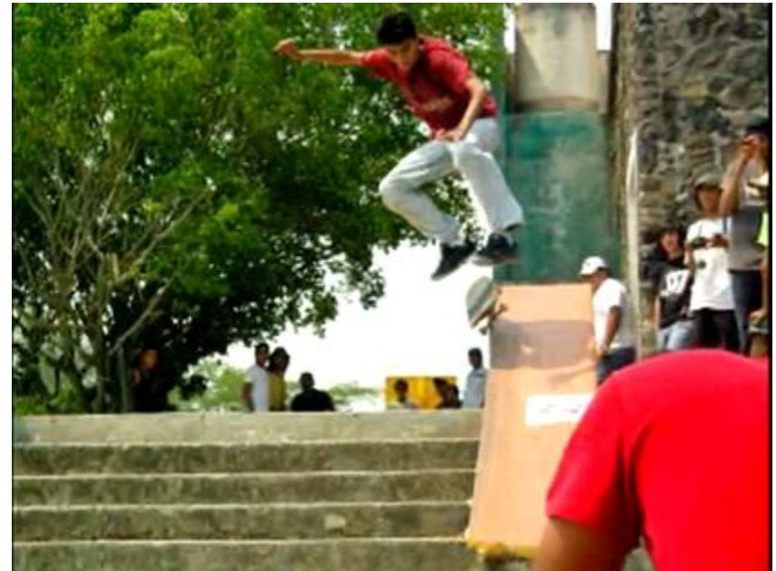
Imagen 5: Fotograma de “Skateboarding”. Carlos Puebla. 2009.

Aun así, en el caso de Morelos dado que el tema es libre y cuyo único requisito es el que sea posible registrar con la cámara sus propuestas de investigación documental, los temas son variados y por lo tanto difíciles de clasificar. Al hacer una revisión longitudinal en estos diez años, algunas tendencias parecen señalar los rumbos que al menos en esta universidad han ido permeando los intereses de grupos importantes de estudiantes de antropología y sus formas particulares de representarlos. Aquí es importante tomar en cuenta tanto con lo que se representa como lo que está ausente aunque su presencia sea cotidiana e importante.