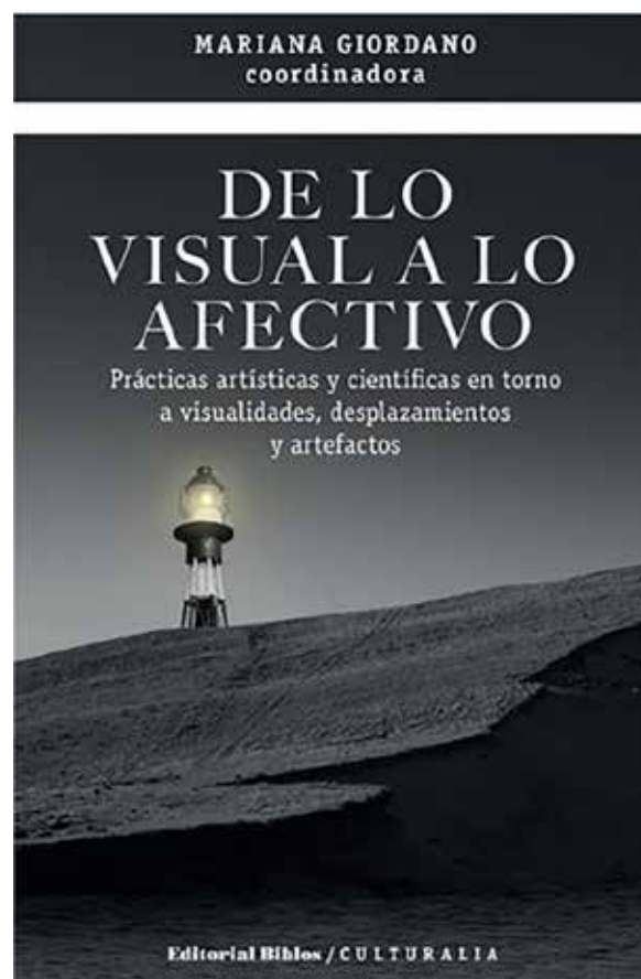
Figura 1. Portada del libro De lo visual a lo afectivo. Prácticas artísticas y científicas en torno a visualidades, desplazamientos y artefactos .