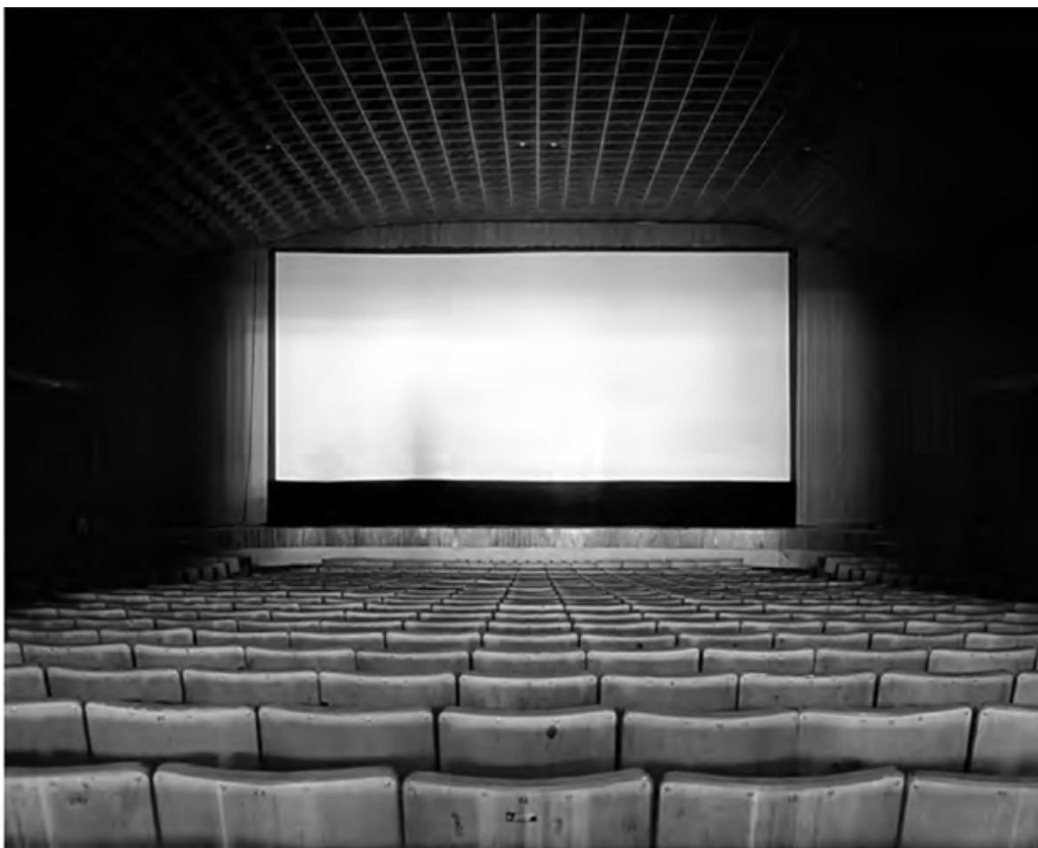
Figura 3. Sala de cine. Autora: Estela Izuel, 2018. Imagen extraída del artículo “Viajar y fotografiar” de Estela Izuela. En De lo visual a lo afectivo. Prácticas artísticas y científicas en torno a visualidades, desplazamientos y artefactos . Ed. Mariana Giordano. Ciudad Autónoma de Buenos Aires: Biblos, 2018.