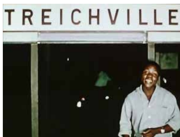
Imagen 2: Fotograma del protagonista de Yo, un negro (1958), de Jean Rouch.