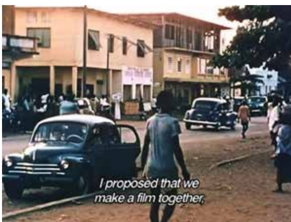
Imagen 1: Fotograma del inicio de Yo, un negro (1958), de Jean Rouch.

Su concepto de antropología compartida de cierta forma se materializa en la construcción de estos relatos, que unen las imágenes filmadas por Rouch y la voz en primera persona de los personajes. La voz de Edouard fue grabada posteriormente a las imágenes. Compartir sus filmaciones con los que han sido los sujetos y actores fue una preocupación central para Jean Rouch.