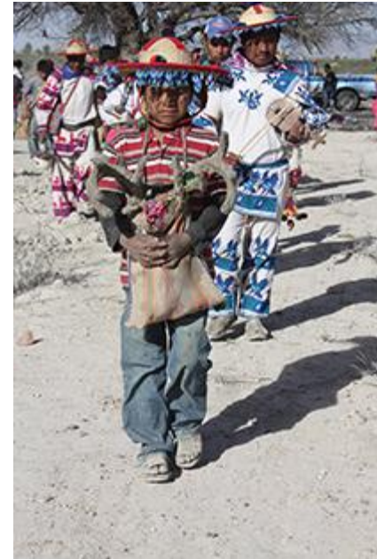
Imagen 6. Un grupo de jícareros (provenientes De Tateikie , San Andrés Cohamiata), dirigiéndose hacia uno de los múltiples lugares sagrados en Wirikuta . 2013.