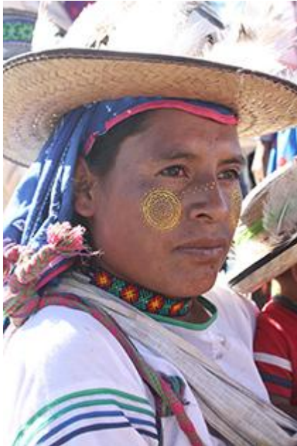
Imagen 7: Xukurikate durante la peregrinación a Wirikuta . En su rostro puede verse la pintura uxa , extraída de una planta que crece únicamente ahí, y cuyo uso facial representa el estado de nierika en el que se encuentra el peregrino, es decir, el consumo de peyote que ya realizó y las visiones que ha tenido con él. Autor: Héctor Sánchez. 2013.

El consumo de esta sustancia psicotrópica, junto con la práctica del auto sacrificio, produce lo que es llamado por los huicholes como nierika , o “don de ver”. El nierika es esa visión que pueden llevar a cabo al ya saber manejar correctamente el consumo de peyote, es controlar los sueños, estando despierto o dormido; es saber qué significan y porqué se nos presentan. Anteriormente expliqué que los maráakate son aquellos individuos quienes pueden moverse entre dos mundos (el humano y de los sueños) gracias a sus habilidades aprendidas en el sistema de cargos y en la reciprocidad entre deidades y ellos mismos. Pues bien, el nierika es la enseñanza más importante que reciben en su experiencia, es la sabiduría transmitida por medio de las visiones oníricas y los sueños.