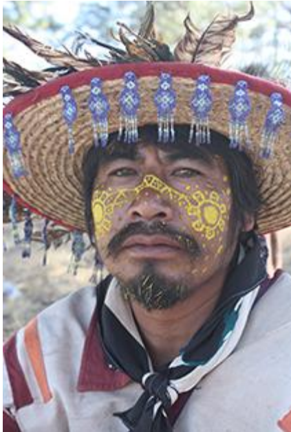
Imagen 8: Xukurikate durante la peregrinación a Wirikuta . En su rostro puede verse la pintura uxa , extraída de una planta que crece únicamente ahí, y cuyo uso facial representa el estado de nierika en el que se encuentra el peregrino, es decir, el consumo de peyote que ya realizó y las visiones que ha tenido con él. Autor: Héctor Sánchez. 2013.