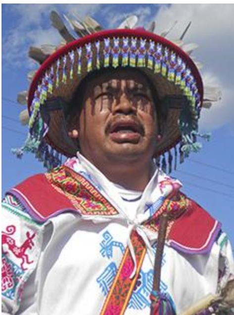
Imagen 3. Un gobernador tradicional en el momento que toma su cargo tradicional. A la par, también es mara'akame , mostrando que el poder político está relacionado con el religioso. Autor: Héctor Sánchez. 2012.

Después de haber visto los diferentes niveles organizativos es necesario reflexionar que el poder en la cultura de los huicholes está muy cercano a la ritualidad y la vida religiosa. Es decir, a través del sistema de cargos los individuos son jerarquizados por los chamanes asignando roles específicos a quienes creen deben cumplirlos, formando de esta manera una estructura de diferencias de poder donde por sus conocimientos, los anteriormente mencionados están sobre de ella y la modelan a partir de sus visiones recibidas y el conocimiento mitológico que ya tienen por experiencia propia.