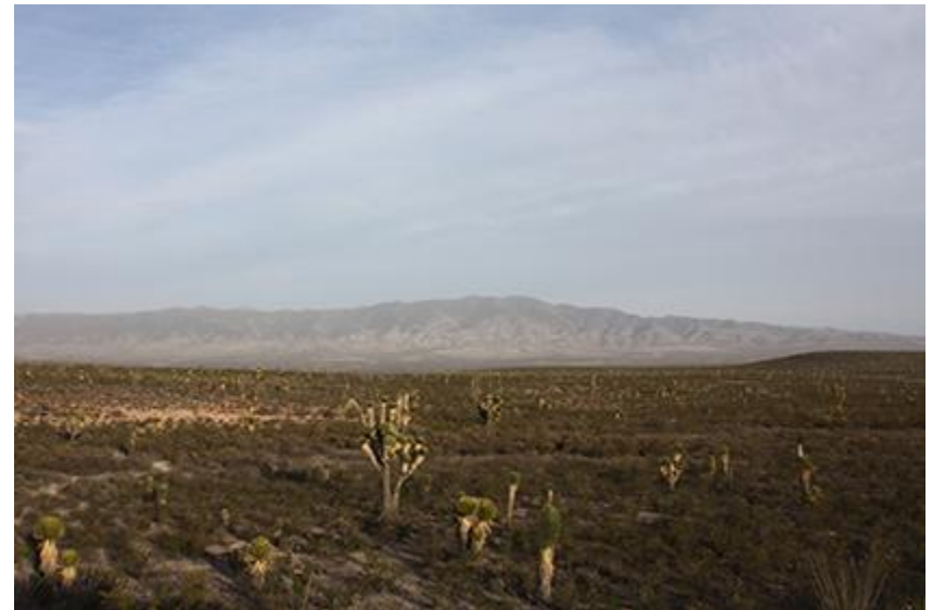
Imagen 9. Desierto de Wirikuta , donde los ancestros viven. 2013.