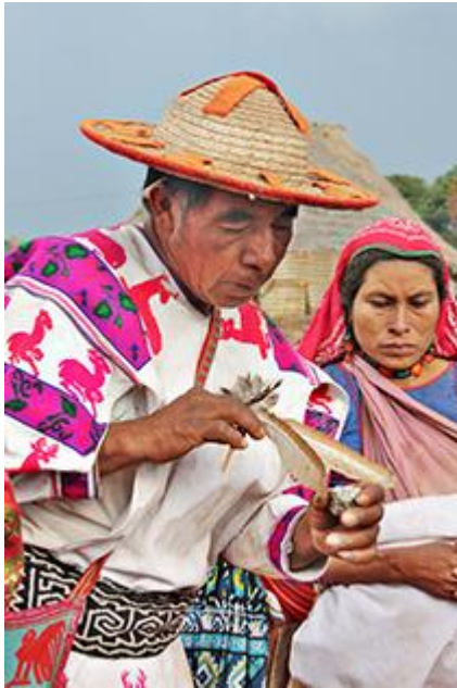
Imagen 11. Un mará'akame consagrando al peyote durante la celebración de una fiesta en el Tukipa . 2013.