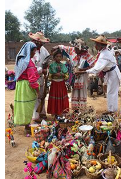
Imagen 12. Mará'akate "bendicen" a una niña en el Xiriki de la familia. Las ofrendas que pueden observarse son realizadas durante la fiesta TateiNeixa , fiesta para despedir a las lluvias. 2012.