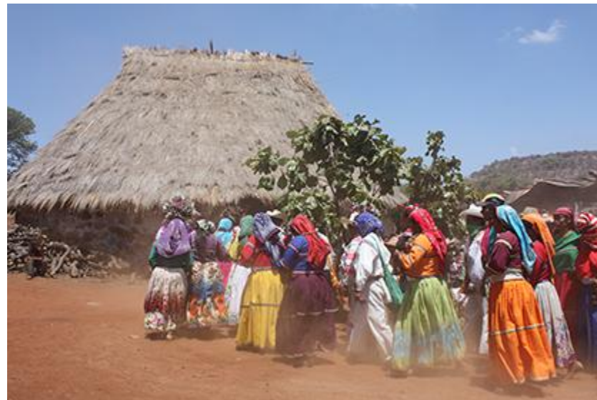
Imagen 2. Celebración de la fiesta Hikuri Neixa en un tukipa de Tateikie Autor: Héctor Sánchez. 2012.

El último nivel es el intercomunal, y corresponde a la Unión Wixárika de Centros Ceremoniales A. C. la cual es una organización de autoridades tradicionales ( kawiterutsiri y xukurikate ) a nivel interestatal que busca defender sus territorios sagrados que por lo general están fuera del límite de la comunidad. Surge como un organismo administrado por las mismas comunidades wixaritari , donde a partir de las asambleas comunales se informa las actividades y acuerdos realizados por sus miembros.