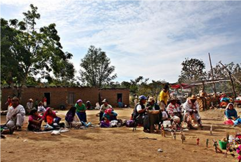
Imagen 1. Una familia celebrando la fiesta Tatei Neixa en el patio de su Xiriki Autor: Héctor Sánchez. 2012.

Entre las obligaciones de las personas pertenecientes a este sistema de cargos se encuentran las siguientes: