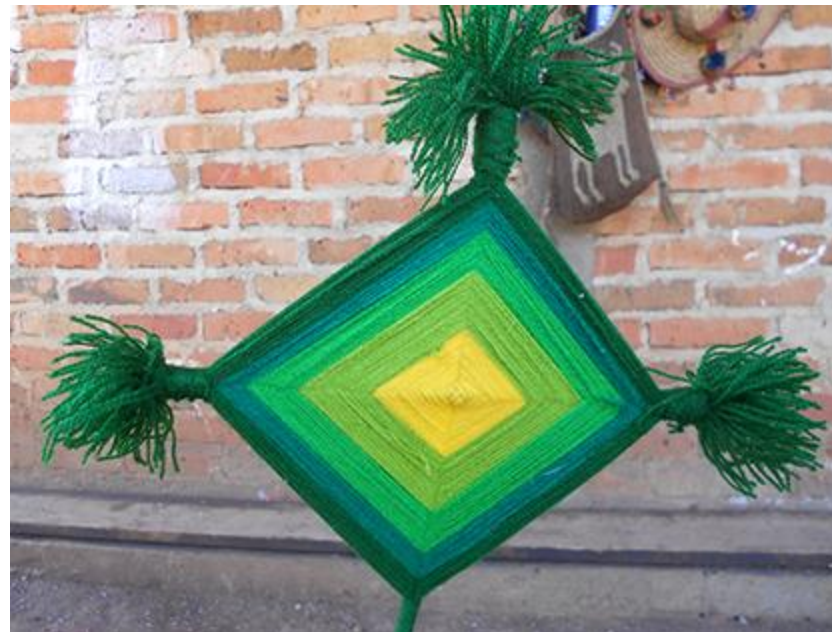
Imagen 4. Ts+kuri , representación artesanal de la geografía sagrada. Autor: Héctor Sánchez. 2012

Empezando con Haramara , lugar ubicado en San Blas, Nayarit en el océano Pacífico y punto cardinal occidental; hace referencia al origen de la vida: el mar. Es donde para los huicholes nacieron sus antepasados haciendo un recorrido hasta el punto cardinal oriental, Wirikuta , en busca del iyari 6 . En el centro de la geografía sagrada se ubica Tea’akata , o lugar de nacimiento del abuelo fuego Tatewari , es un centro sagrado ubicado en la Sierra Madre Occidental; también el lugar central refiere a las comunidades huicholas, ubicadas en esa misma sierra. Al llegar al punto cardinal oriental, el desierto de Wirikuta , es donde los antepasados cazaron por primera vez al venado o Tamatsi Kauyumarie , el venado al ser cazado se auto sacrificó para que los humanos encontraran el iyari a través de su sangre, y de sus huellas nació el peyote. También Wirikuta es el lugar del padre Sol o Tayau , es decir que es el lugar donde por primera vez iluminó al mundo. Se ubica en San Luis Potosí, en el llamado “altiplano potosino”. La importancia de dicho lugar en la sociedad wixárika es de gran peso, ya que además de reproducirse el pasaje mítico que dio origen a la vida al realizarse la peregrinación, es donde son iniciados los mara’akate 7 , y es donde crece el peyote o hikuri .