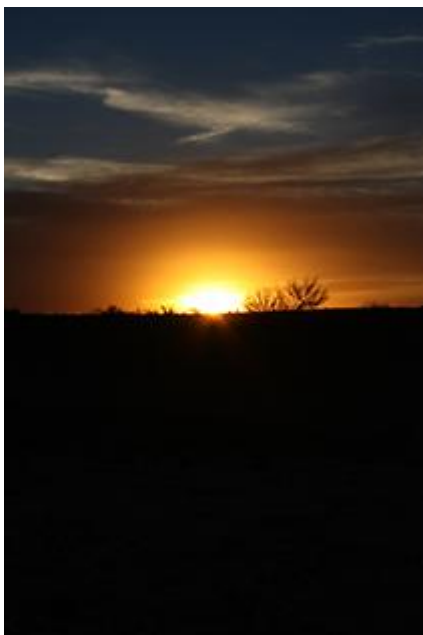
Imagen 11: El día y la noche, opuestos en la mitología, espacio sagrado y tiempo ritual huichol. En la fotografía 10 puede verse el manantial sagrado de Tuimaye'u , en las cercanías a Wirikuta En la fotografía 11, la caída del Sol en la comunidad de Tateikie . 2013.

Pero, ¿por qué incluir estas prácticas rituales en el estudio de la defensa de un territorio?, Debido a que como ya expliqué, el mismo territorio es representado en las fiestas y juega un papel muy importante en la vida ritual y política de la comunidad. Durante las fiestas tradicionales podemos ver el concepto de reciprocidad de los huicholes, el cual es clave. Su realización se lleva a cabo para intercambiar con las deidades un tributo (en forma de ofrenda) para mantener el equilibrio de la naturaleza, de la salud de la familia, del ganado, del maíz; en fin, el equilibrio de la vida. Es por eso que la resistencia en el caso huichol la entiendo como la protección de la propia cultura y de su espacio a través de la acción ritual. Resistencia que proviene desde la lógica del pueblo indígena, la cultura huichola ya la he explicado como una sociedad que está influida por su cosmovisión en diversos aspectos, incluido el político. Pues bien, aquí quisiera enunciar que la resistencia es la práctica ritual para salvar guardar el territorio a través de la acción ritual, ya que la actividad socio religiosa tiene como punto final un bienestar cultural.