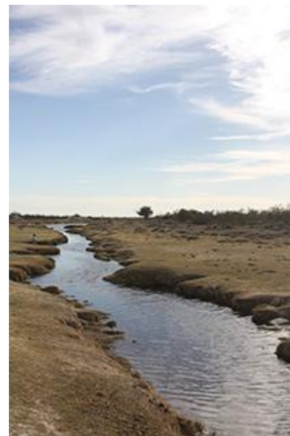
Imagen 10: El día y la noche, opuestos en la mitología, espacio sagrado y tiempo ritual huichol. En la fotografía 10 puede verse el manantial sagrado de Tuimaye'u , en las cercanías a Wirikuta En la fotografía 11, la caída del Sol en la comunidad de Tateikie . Autor: Héctor Sánchez. 2013.

El calendario ritual se basa, en principio, en la oposición día-noche, temporada de lluvias-temporada de secas. El desarrollo ritual va a la par del crecimiento del maíz a lo largo del año. La época de lluvias, es el momento de la noche, la oscuridad, del diluvio según la explicación mitológica, el cual fue traído por la diosa Takutsi Nakawe “ Nuestra Abuela Crecimiento ” deidad de la fertilidad. En esa época la actividad ritual es mínima, puesto que el crecimiento del maíz sucede y el sol aún no ilumina, mitológicamente hablando. La siguiente época, “la de secas”, toda la actividad ritual se lleva a cabo; puesto que es la época que ya resplandeció el Sol sobre el mundo, el maíz ya creció y se le debe rendir tributo en cada xiriki y tukipa por medio de las fiestas neixa .