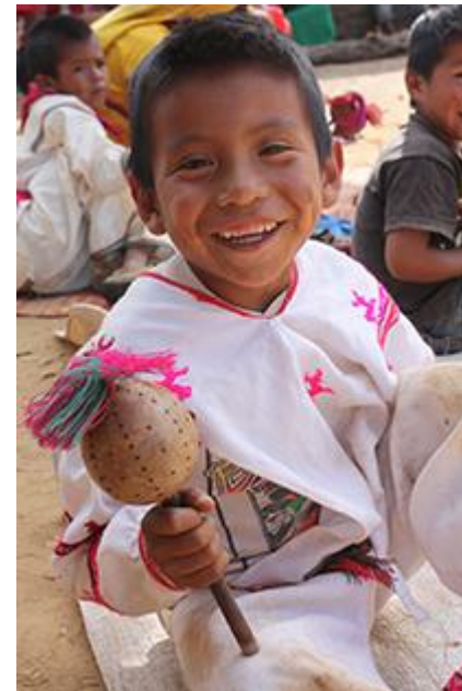
Imagen 13. Niño participando en la fiesta Tatei Neixa . Cabe destacar que uno de los objetivos de la defensa territorial es el equilibrio de la cultura y el bienestar de sus integrantes. Autor: Héctor Sánchez. 2012.

Las fiestas tradicionales y la cosmovisión como resistencia cultural: Me parece interesante analizar las prácticas religiosas no solo como parte de un sistema de creencias y ritos sino más bien como un discurso de resistencia cultural, es decir, una resistencia por querer defender su territorio y por consecuencia defender su sistema de creencias; ya que la composición del sistema de cargos, la distribución de los centros ceremoniales en la sierra, el diseño de ellos y los rituales, todo esto se relaciona con la geografía sagrada.