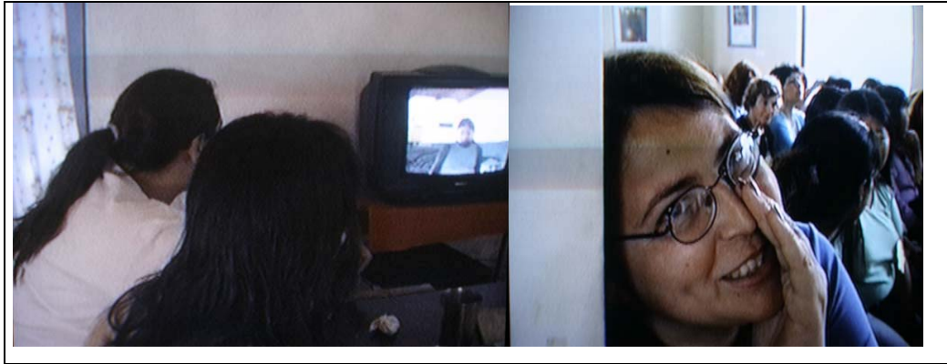
Foto 5 (izquierda) Las promotoras viéndose a sí mismas. Foto 6 (derecha) Complicidad con la cámara.