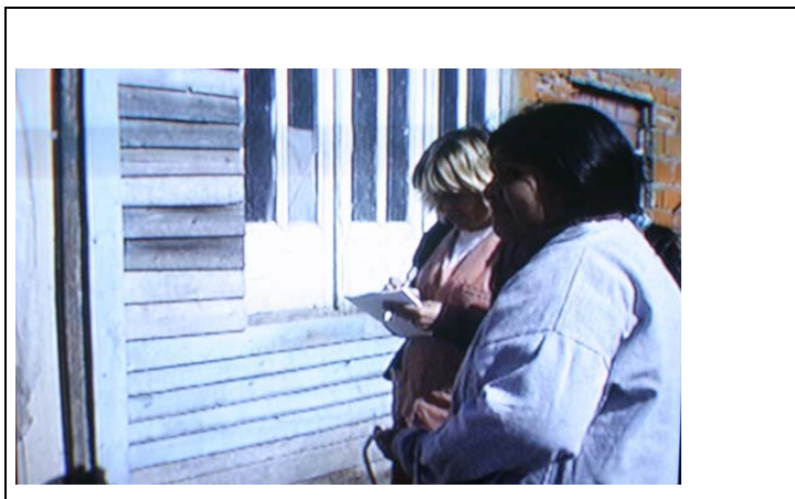
Fotos 1 y 2 .Trabajando en el barrio con el personal de salud.